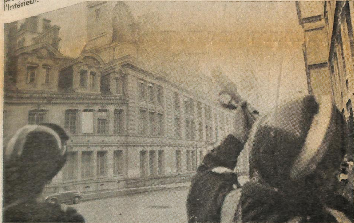
Il est facile de tirer sur la Sorbonne. Il est impossible d'arrêter la marche vers une Université populaire, ouvriers-étudiants